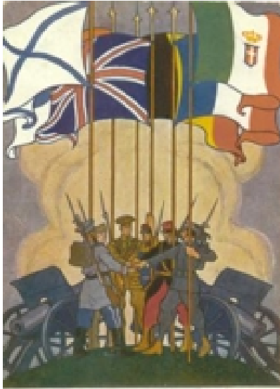
Gli alleati. - Les alliés. - The allies.