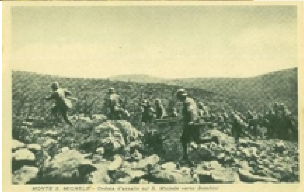
MONTI S. MICHELE - Vista d'assalto sul S. Michele verso Banchi