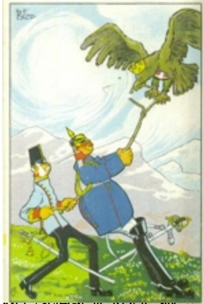
Un soldato tedesco che punta la pistola sul soldato francese che tiene l'aquila. (2/A)